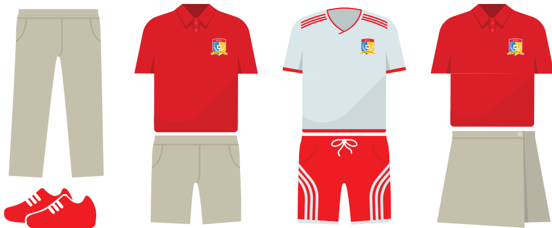
Đồng phục ROYAL SCHOOL